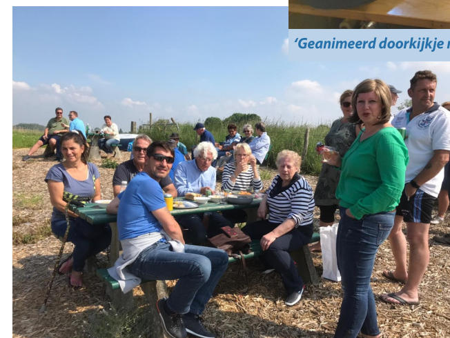
'De steigerborrel in Willemstad 2019..'