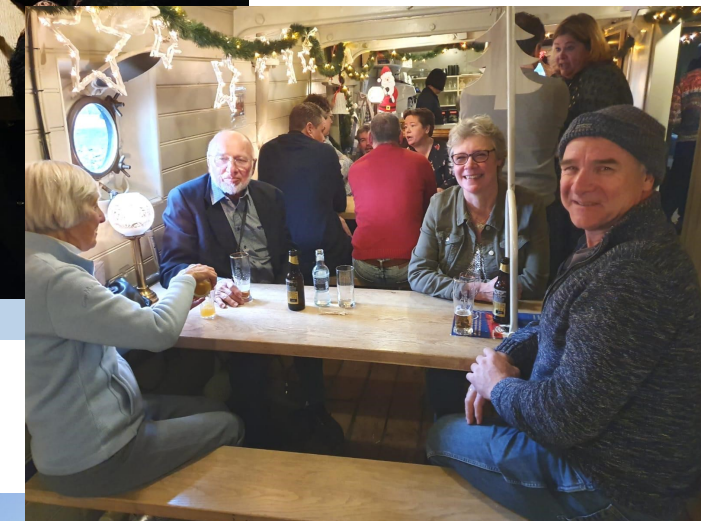
'Geanimeerd doorkijkje naar de Buffelbar..'