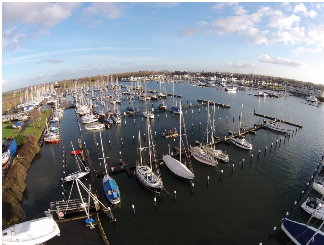
'Onze havens: hoogwaardig, duurzaam, veilig, betaalbaar..'