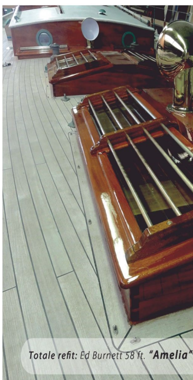
Totale refit: Ed Burnett 58 ft. "Amelia"

refit | teakdekken | jachtinterieurs | schilderwerk | polyesterreparaties | osmosebehandelingen