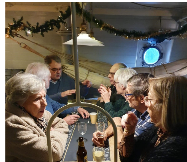
'Verhalen van toen..'