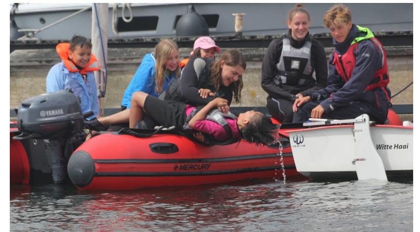
'Met zo'n RIB vaar je niet even weg..'