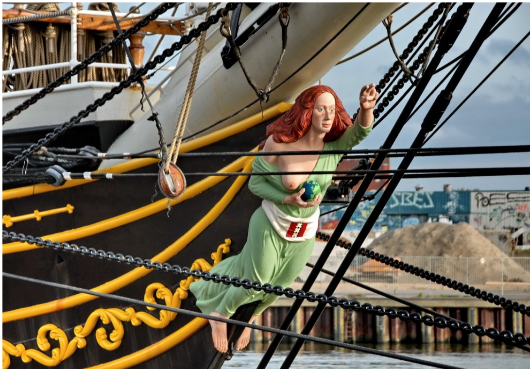
'Boegbeeld Stad Amsterdam'

Bron: Michiel van Straten – 100 Maritieme Uitvindingen