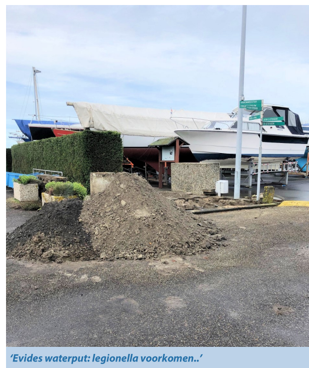
'Evides waterput: legionella voorkomen..'

De Heliushaven werkt aan duurzaamheid en energiebesparing. In dat verband kunnen wij melden dat de proefopstelling met de Flowerwindturbines, na enige vertraging, nu gepland staat voor oplevering in april. De havencommissie onderzoekt nog