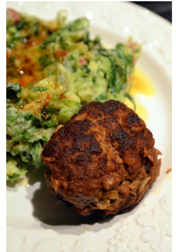
'Gehaktbal van Takeaway' Wikipedia Commons

Bron: Jacques Meerman: Kleine geschiedenis van de Nederlandse keuken